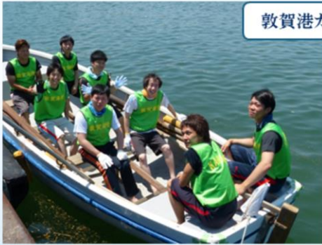
敦賀港カッターレース参加