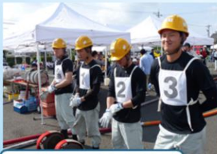
敦賀操法大会参加