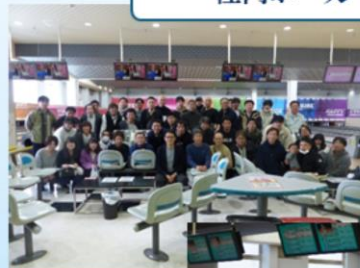
社内ボーリング大会