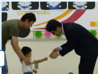
ファミリーデー企画