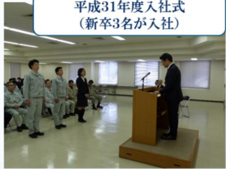
平成31年度入社式 (新卒3名が入社)