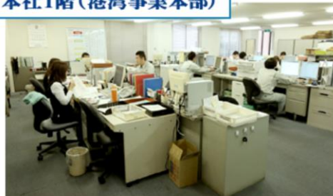
本社1階(港湾事業本部)