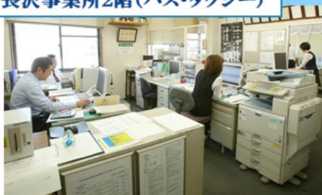
長沢事業所2階(バス・タクシー)