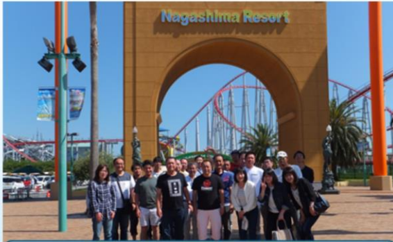
平成30年度社員旅行 (ジャズドリーム長島にて)