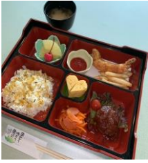
【小人料理イメージ写真】