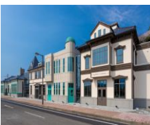
【敦賀ムゼウムイメージ写真】