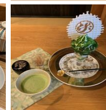
【中道源蔵茶舗イメージ写真】