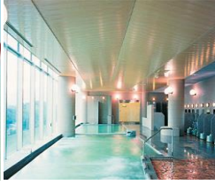
【リラ・ポートイメージ写真】