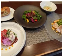
【大人料理イメージ写真】