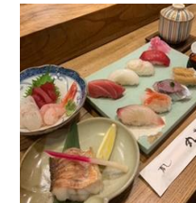
【大人料理イメージ写真】