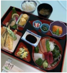
【大人料理イメージ写真】