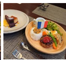
【小人料理イメージ写真】