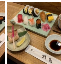
【小人料理イメージ写真】